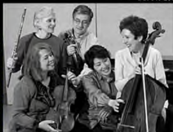
THE PIERROT CONSORT